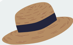
chapeau ou casquette

Afin de garantir le bien être de votre proche, Merci de mettre à sa disposition les éléments suivants, avant la saison estivale.